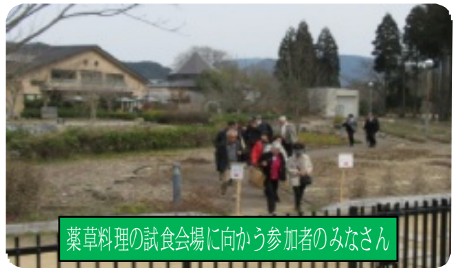
薬草料理の試食会場に向かう参加者のみなさん