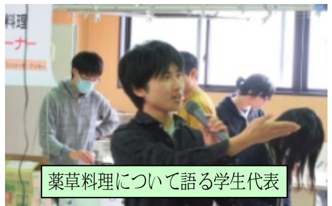
薬草料理について語る学生代表